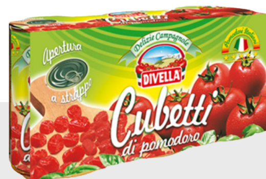
Tomates en cubes