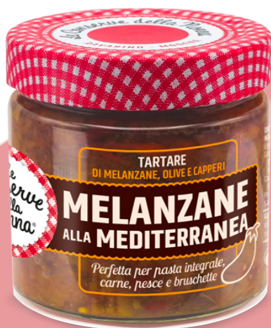
Aubergines à la méditerranéenne