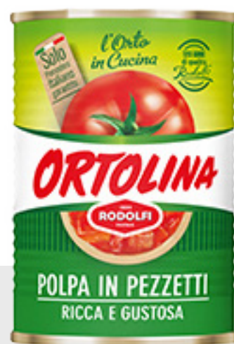
Polpa tomates concassées