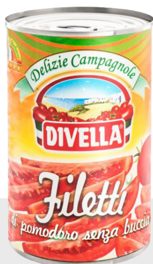
Tomates en filets