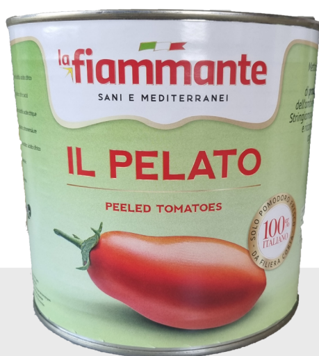
Tomates pelées 3/1