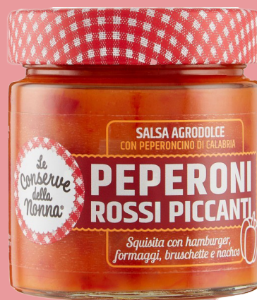
Sauce aigre-douce au piment