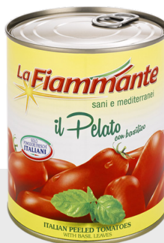
Tomates pelées au basilic