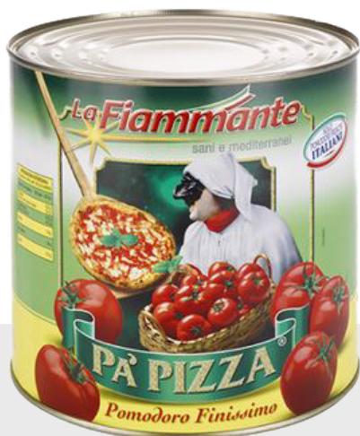
Polpa fine Pa'Pizza