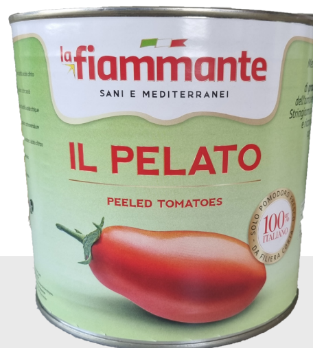
Tomates pelées 3/1