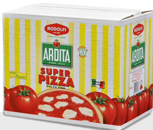
Box tomate - Pizza sauce