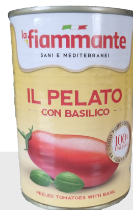
Tomates pelées au basilic