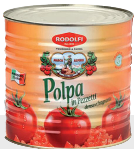
Polpa tomates concassées