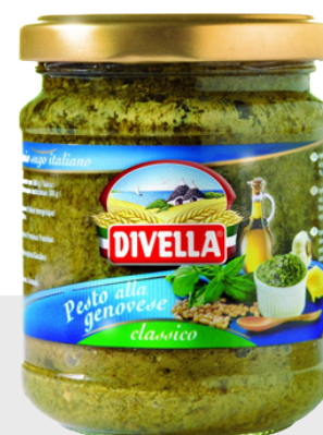
Pesto alla genovese