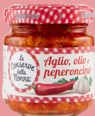
Ail - huile - piment