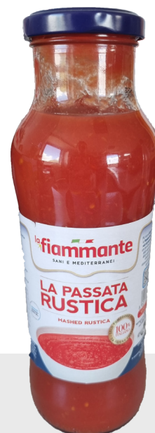
Polpa tomates concassées