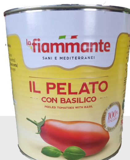
Tomates pelées au basilic 3/1