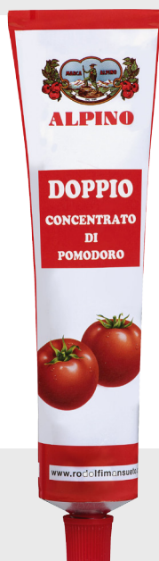
Double concentré de tomates