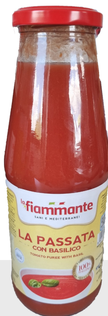
Passata au basilic