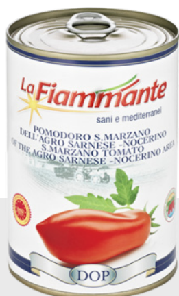
Tomates pelées San Marzano