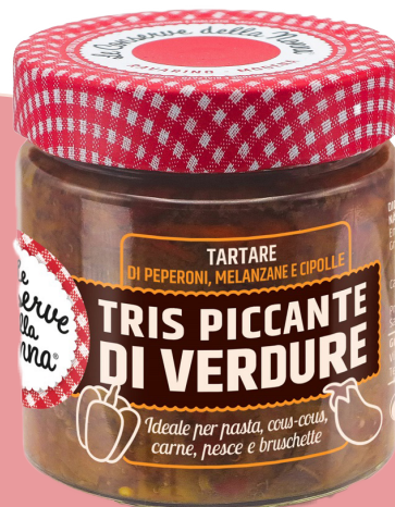
Tartare de poivrons, aubergines et oignons