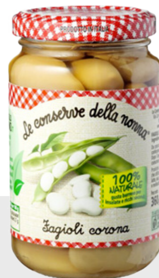
Haricots blancs Corona