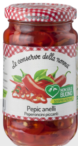
Piments forts rondelle