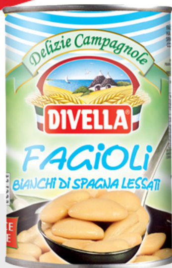
Haricots blancs d'Espagne