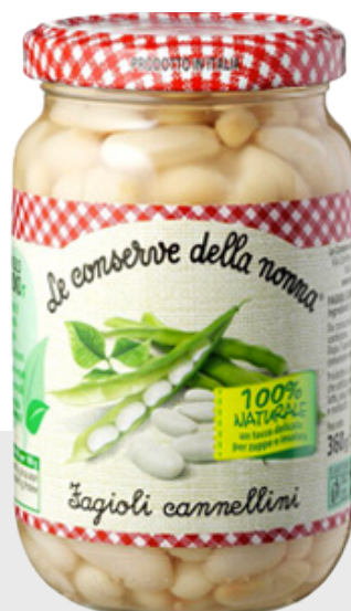
Haricots blancs Cannellini