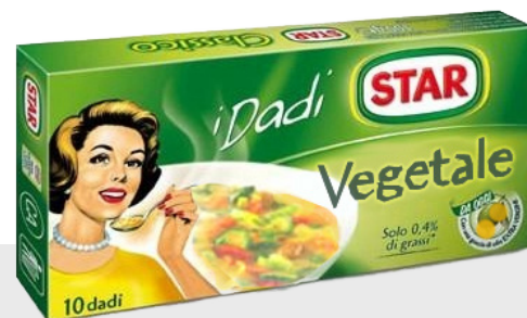
Daddi Star Classico