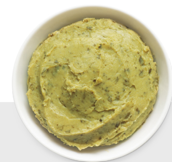
Fèves et chicorées