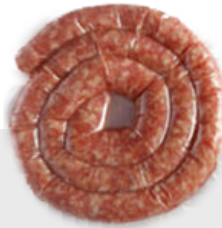
Saucisse Luganega nature