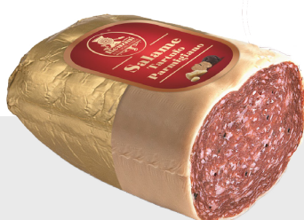
Salami à la truffe recouvert de parmesan