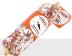
Salami au Piment