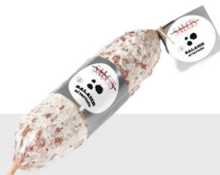
Salami à la truffe