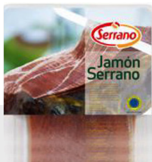
Jambon Serrano pré-tranché