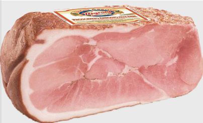
Jambon aux herbes