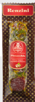
Salami pistaches 200 gr