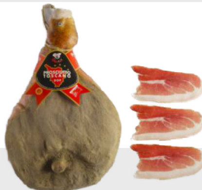
Jambon 12 mois d'affinage