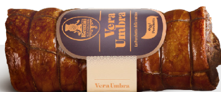
Porchetta «Vera Umbra»