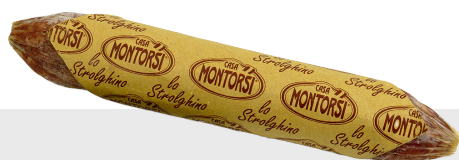
Salami Lo Strolghino doux