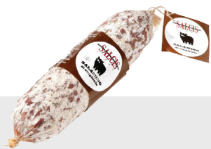
Salami au sanglier