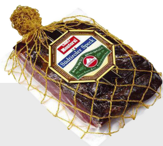
Speck (sous vide)