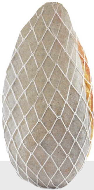
Jambon cru Culata Langhirano Montali 1541900