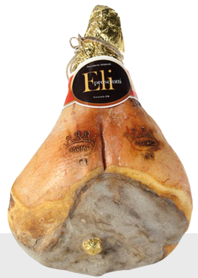
Jambon de Parme Sélection 17/18 mois 14106

Pour plus d'informations ou pour passer commande : 03 89 57 04 57