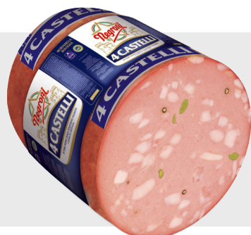
Mortadelle 4 Castelli