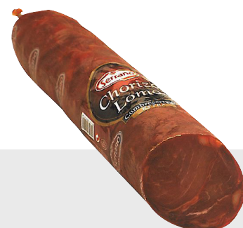
Chorizo Piquant pur porc