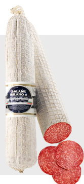
Salami Milano Environ 2 kg 14032