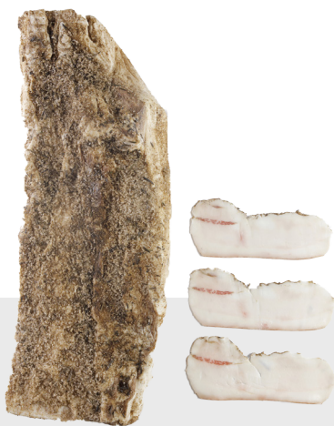
Lard Blanc salé