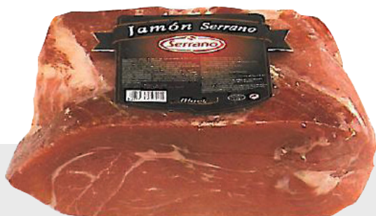
Jambon Serrano (désossé)