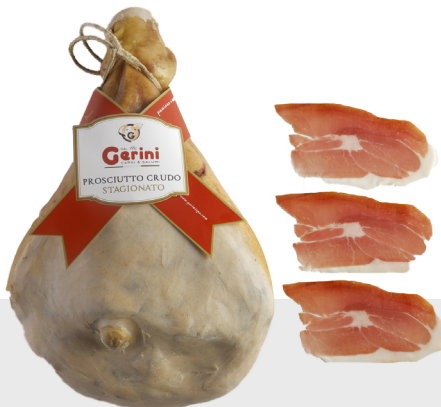
Jambon DOP 12 mois d'affinage