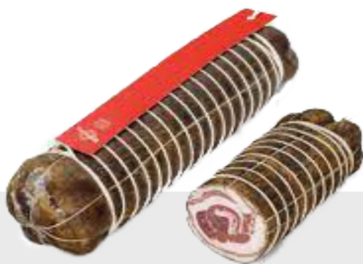
Pancetta au poivre