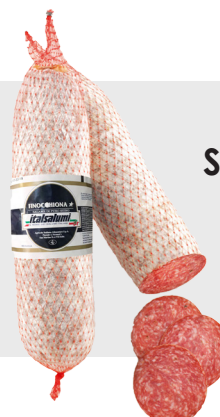
Salami Finocchiona Environ 2 kg 14030