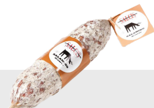
Salami au cerf