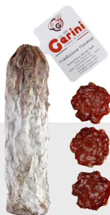
Salami de sanglier