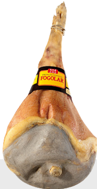
Jambon San Daniele DOP 14108