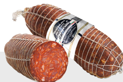
Ventricina Piquante Environ 2 kg 14042