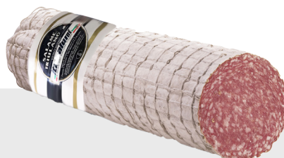
Salami Friulano Environ 2 kg 14031