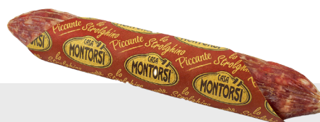
Salami Lo Strolghino piquant