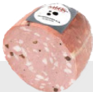
Mortadelle à la truffe