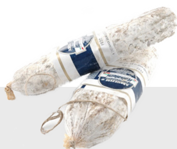
Salami Abruzzese Environ 2 kg 14027