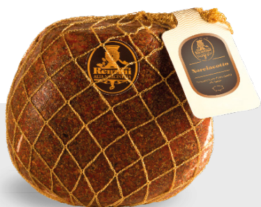
Jambon cuit aux herbes