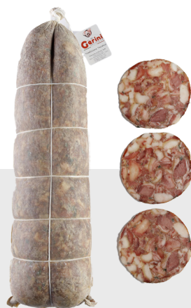
Sopressata (fromage de tête)