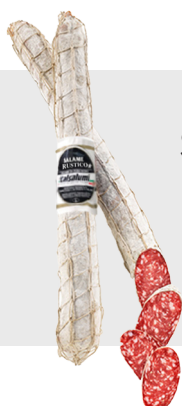
Salami Rustico Environ 2 kg 14028