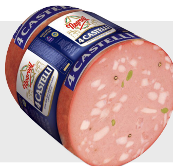
Mortadelle 4 Castelli (avec pistaches)