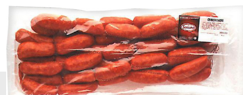
Chorizo à griller