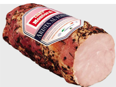
Arista al Forno