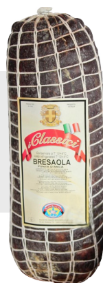
Bresaola Punta d'Anca