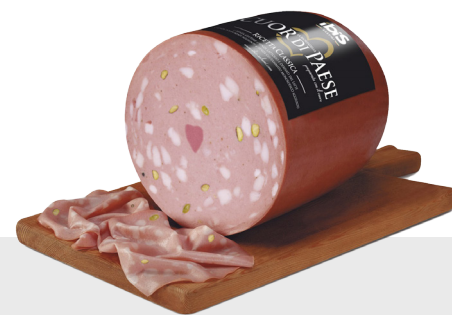
Mortadelle Cuor di Paese Pistache