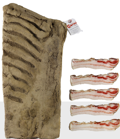
Pancetta tesa Nostrale