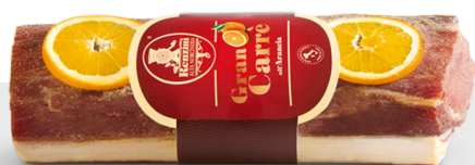
Gran carré à l'orange