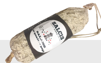
Salami au 4 poivres