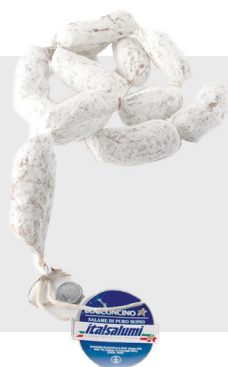
Bocconcini Environ 2 kg 14015