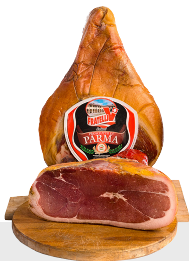
Jambon de Parme Sélection 20 mois