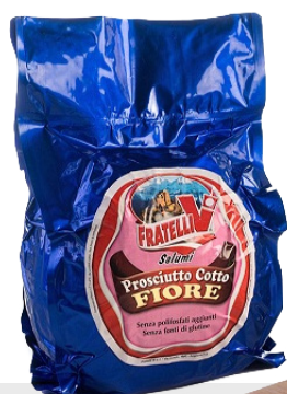
Jambon cuit Fiore