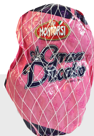
Jambon Italie Cuor di prosciutto