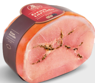
Jambon à la truffe