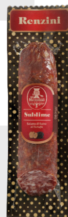
Salami à la truffe 180 gr