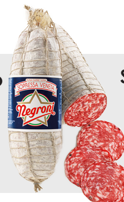
Salami Sopressa Veneta (à l'ail) Environ 2 kg 14035