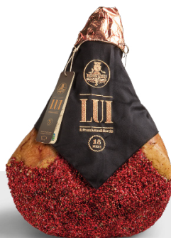
Jambon cru Norcia IGP 18 mois