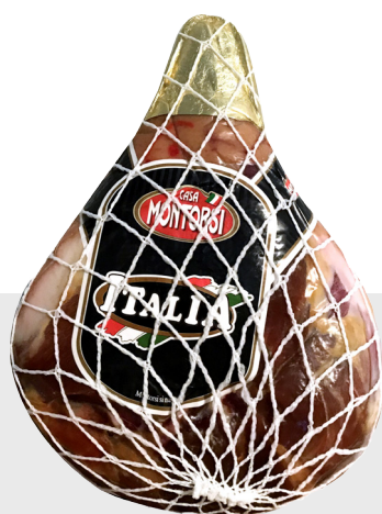
Jambon italie Primamore