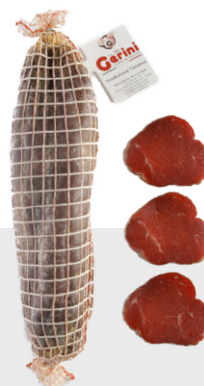
Bresaola de sanglier