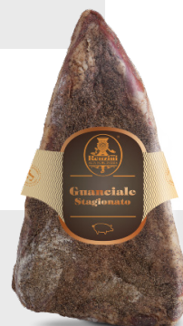
Joue del Norcino