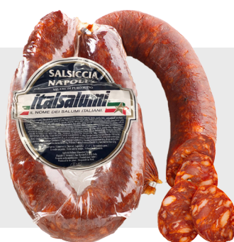
Salami Napoli piquante