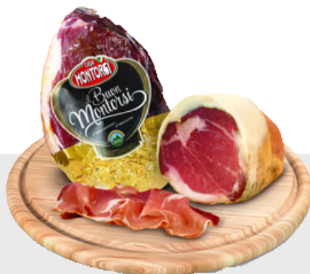
Jambon cru Culatta