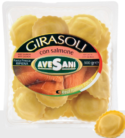
Girasole au saumon