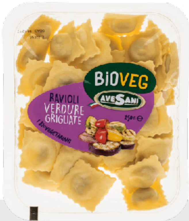
Ravioli Légumes grillés