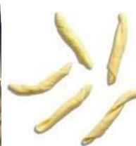
Treccie di Giuletta