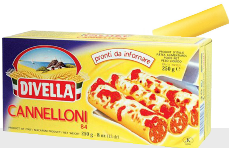
Cannelloni Semoule n°84