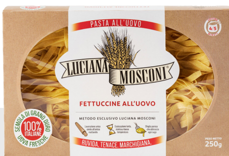
Fettuccine aux oeufs