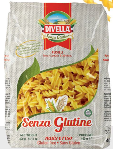
Fusilli sans gluten