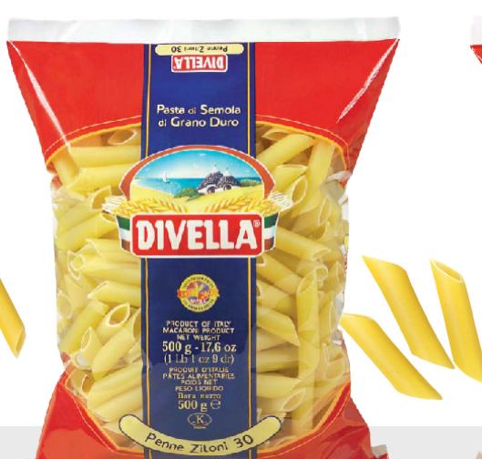
Penne Zitoni n°30