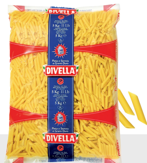
Penne Rigate Vrac