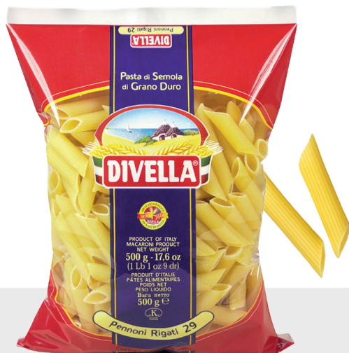
Pennoni Rigati n°29