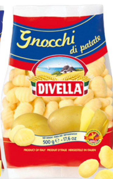
Gnocchi di patate