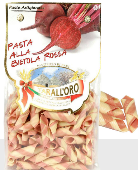
Garganelli à la betterave