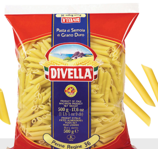
Penne Regine n°36