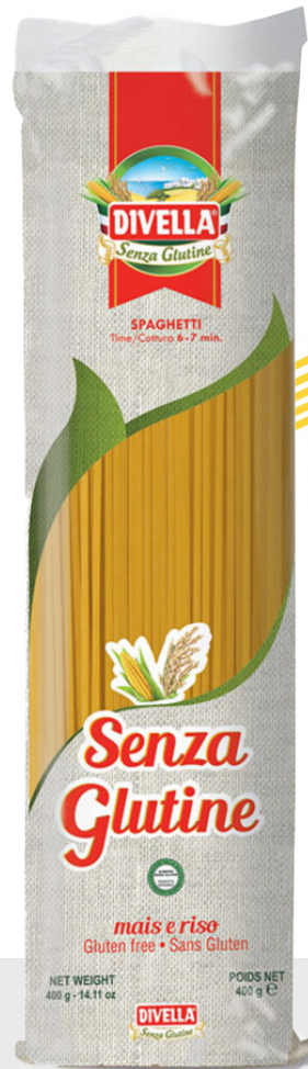
Spaghetti sans gluten