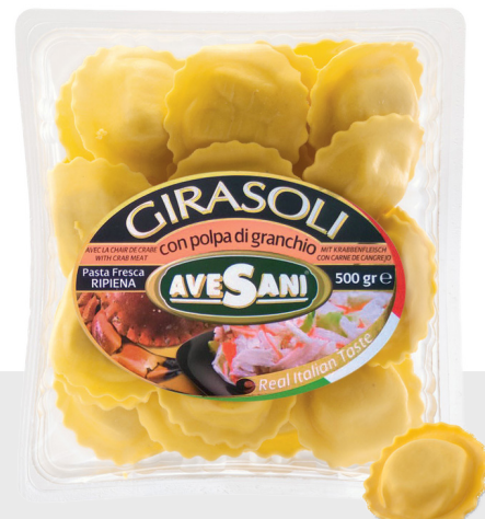
Girasoli au crabe