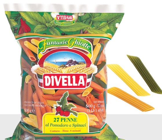
Penne Rigate tricolori n°27