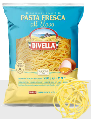
Spaghetti alla chitarra