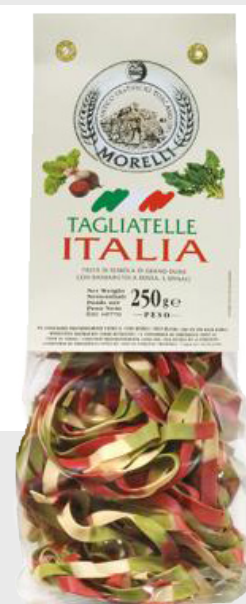
Tagliatelles tricolori Italia