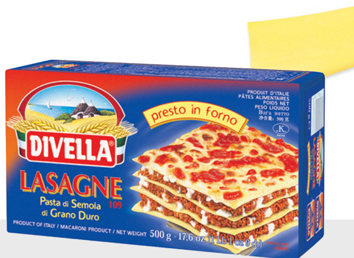
Lasagne aux oeufs n°108