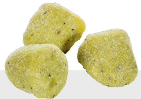
Gnocchi au basilic