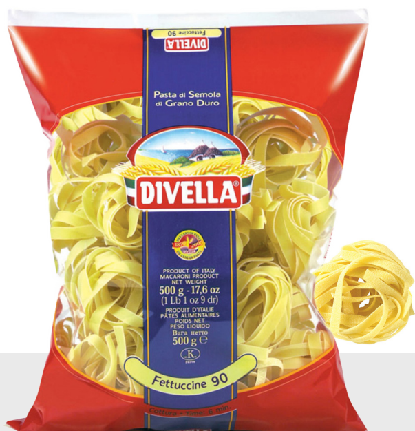
Fettuccine Nidi n°90