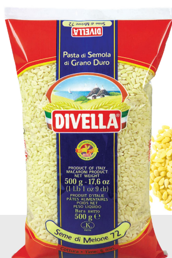
Seme di Melone n°72