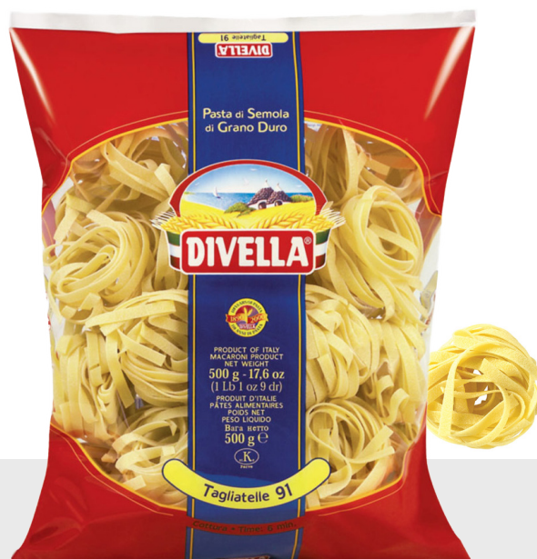
Tagliatelle Nidi n°91