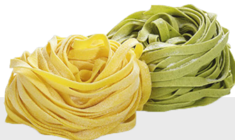
Paglia e Fieno