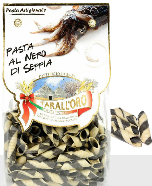
Garganelli noir de seiche