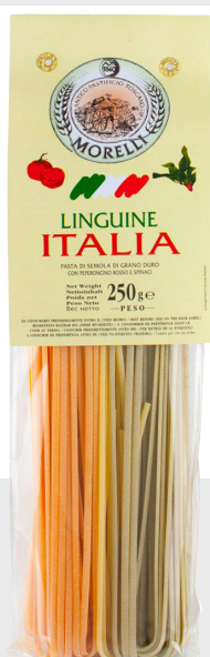
Linguine tricolori Italia