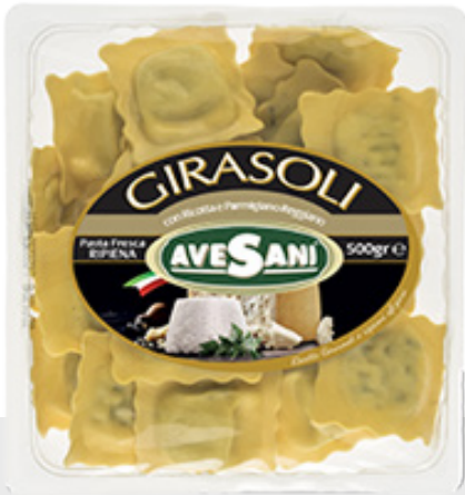
Girasoli ricotta et parmesan