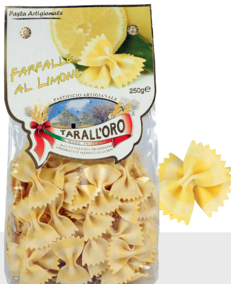
Farfalle au citron