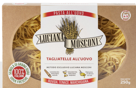
Tagliatelle aux oeufs