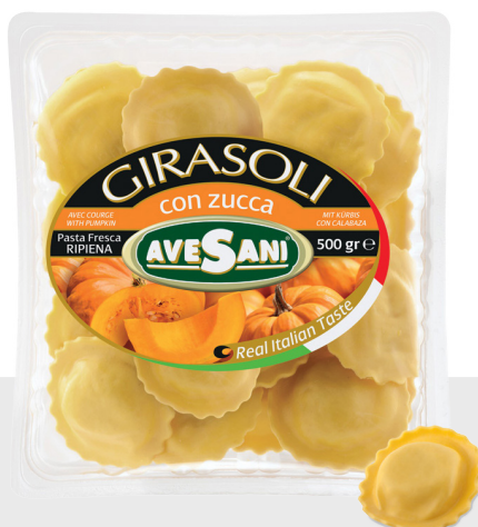
Girasoli au Potiron