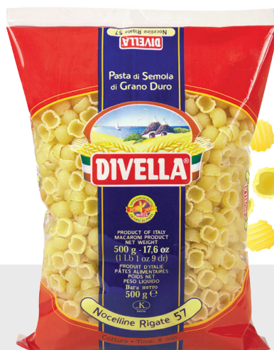
Nocelline Rigate n°57