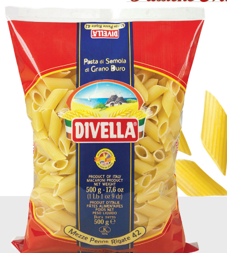
Mezzi Penne Rigate n°42