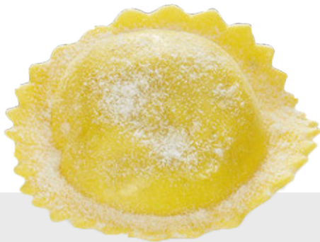
Medaglione N'duja et Scamorza