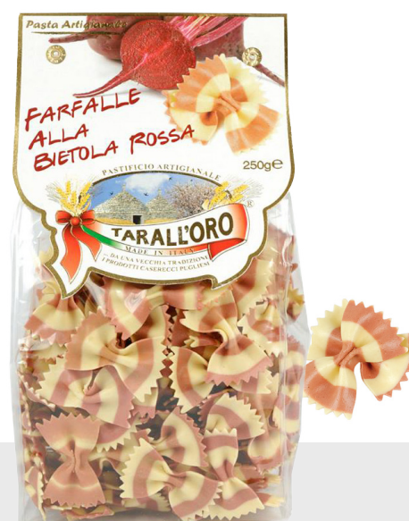
Farfalle à la betterave