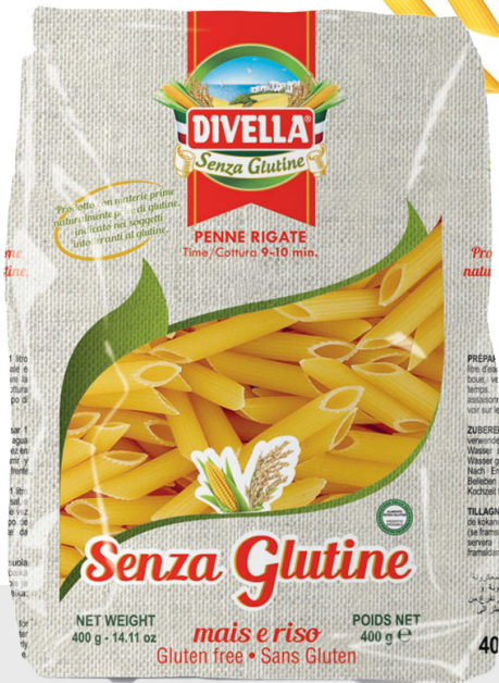
Penne Rigate sans gluten