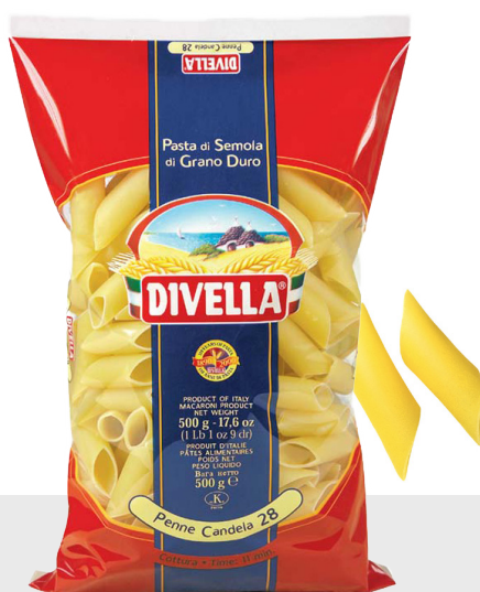
Penne Candela n°28