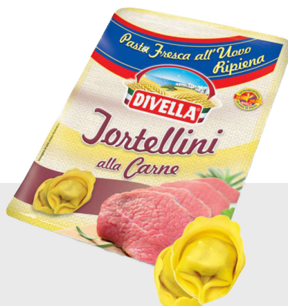
Tortellini à la viande