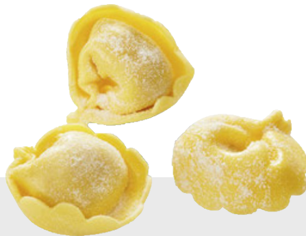
Cappelletto à la viande