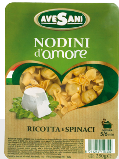
Nodini Ricotta Epinars