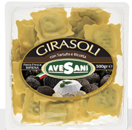
Girasole aux truffes et ricotta