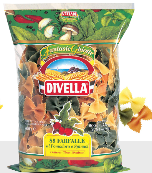
Farfalle tricolori n°85/1