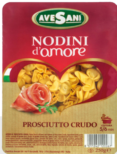
Nodini Jambon Cru