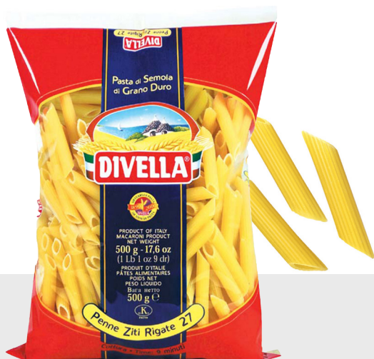
Penne Rigate n°27