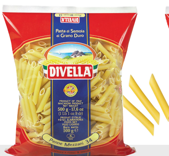
Penne Mezzani n°34