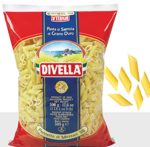
Pennette Mezzani n°38