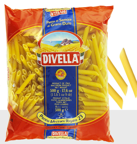
Penne Mezzani Rigate n°23