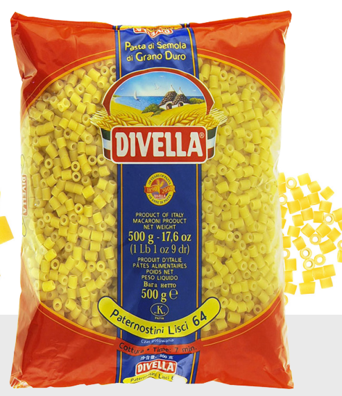
Paternostini Lisci n°64