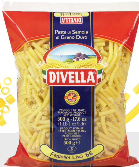
Fagiolini Lisci n°66