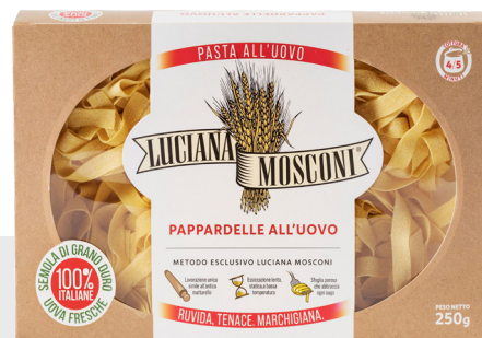
Pappardelle aux oeufs