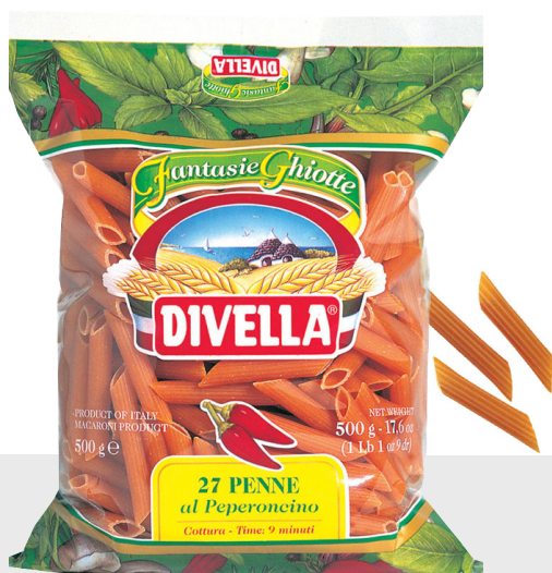
Penne aux piments