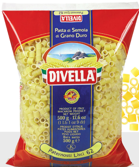
Paternosti Lisci n°62