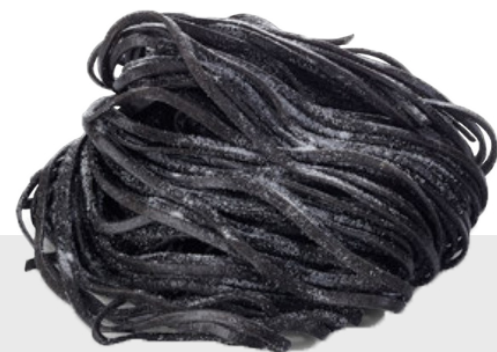
Taglioni noir de seiche