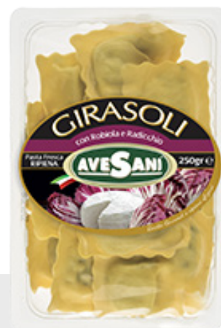
Girasoli Robiola et Radicchio