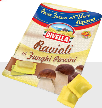
Ravioli aux champignons