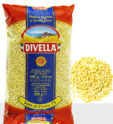
Seme di Cicoria n°73