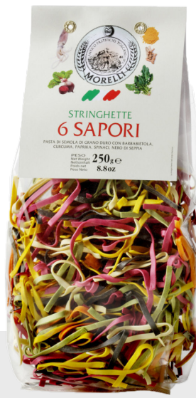
Stringhette aux 6 saveurs