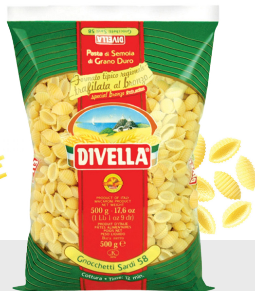
Gnocchetti sardi n°58