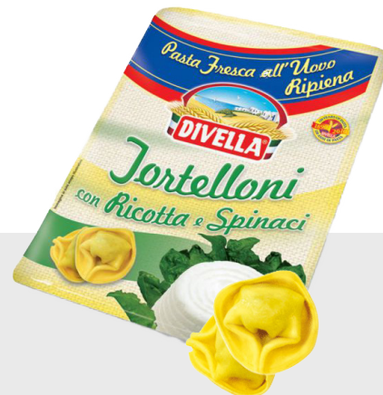
Tortellini ricotta et épinards