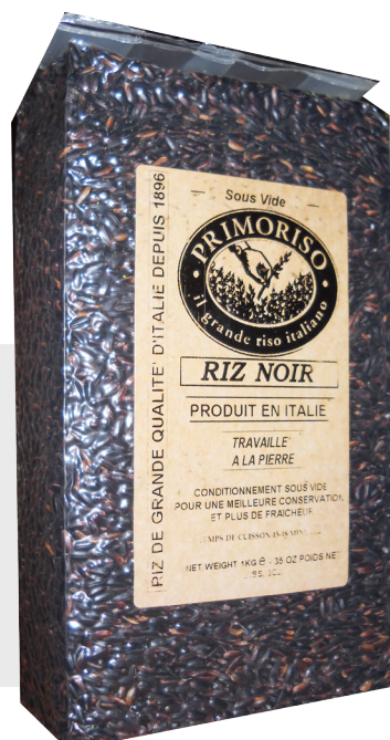
Riz Venere Noir