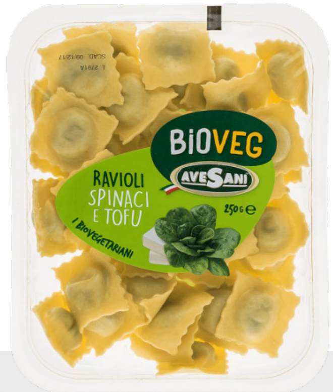
Ravioli Epinards et tofu