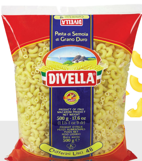
Chifferini Lisci n°48