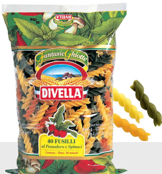
Fusilli tricolori n°40/1