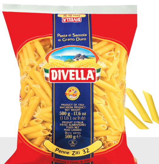
Penne Lisce n°32