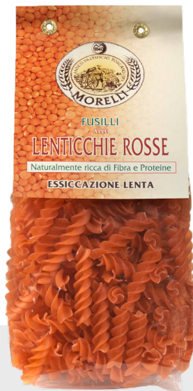
Fusilli à la farine de lentilles rouges