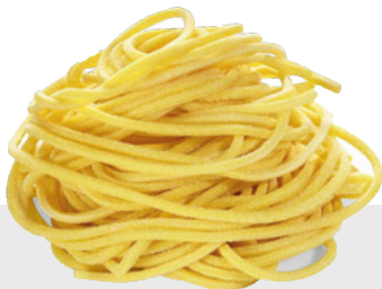
Spaghetti alla Chitarra