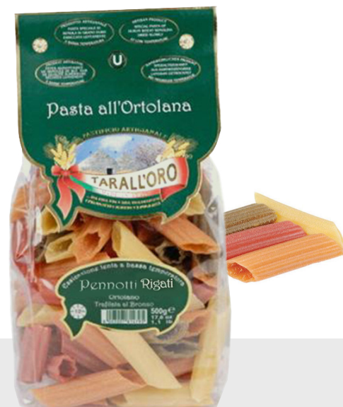
Penotti Rigati tricolors