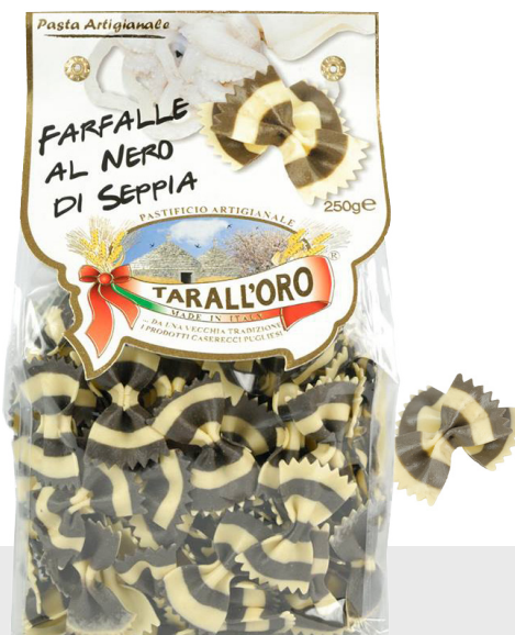
Farfalle noir de seiche