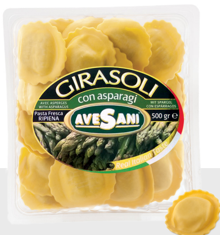
Girasoli aux Asperges

LES PRODUITS CI-DESSOUS SONT UNIQUEMENT DISPONIBLES SUR PRECOMMANDE