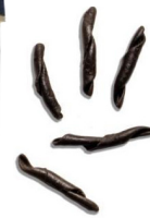
Nerelli noir de seiche