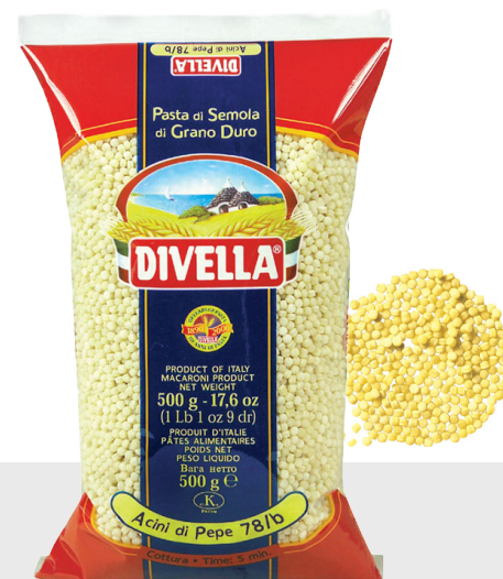
Acini di Pepe n°78/b