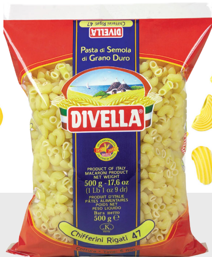
Chifferini Rigati n°47