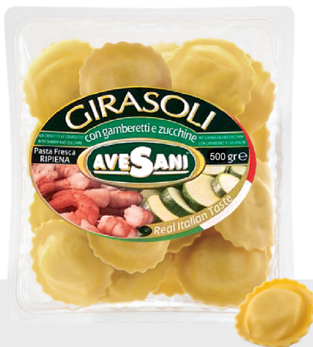
Girasoli aux crevettes/courgettes