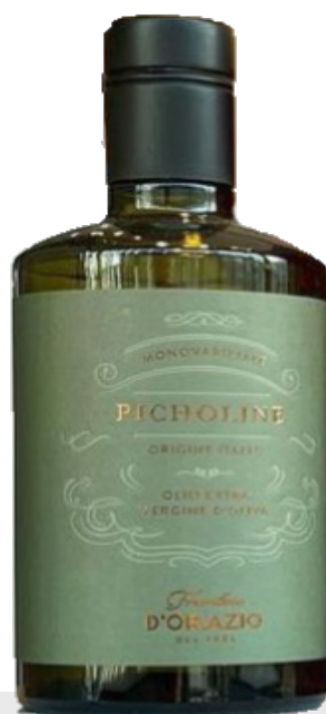
Huile d'olive Extra Vierge Picholine