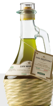
Huile d'olive extra vierge