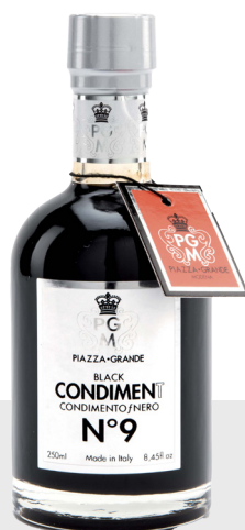
Vinaigre balsamique n°9 Piazza