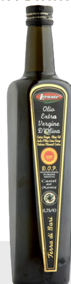
Huile d'olive extra vierge Terra di Bari 12 x 75 cl 23069