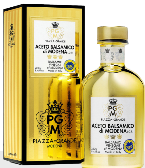
Vinaigre balsamique Oro Chrome