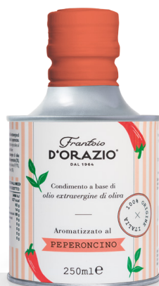
Huile d'olive Extra Vierge au piment