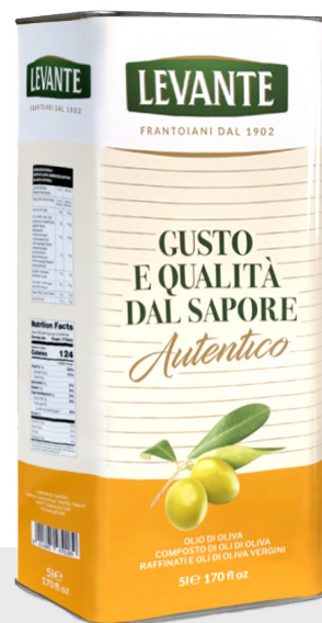
Huile d'olive 4 x 5 L 26070