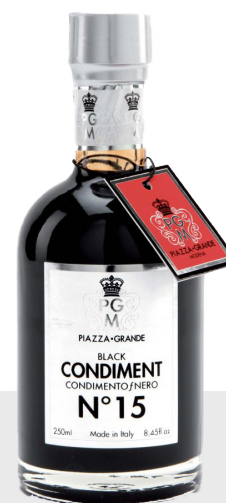
Vinaigre balsamique n°15 Piazza