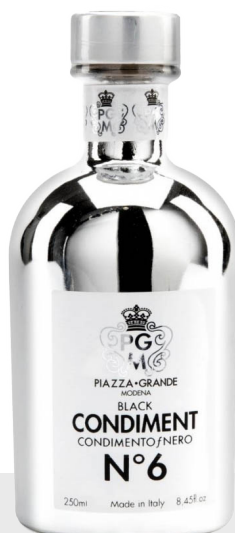
Condiment balsamique n°6 Chrome Line