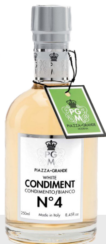
Condiment balsamique blanc n°4 Piazza