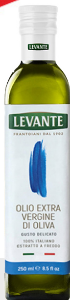
Huile d'olive extra vierge 100% italienne 12 x 25 cl 26072