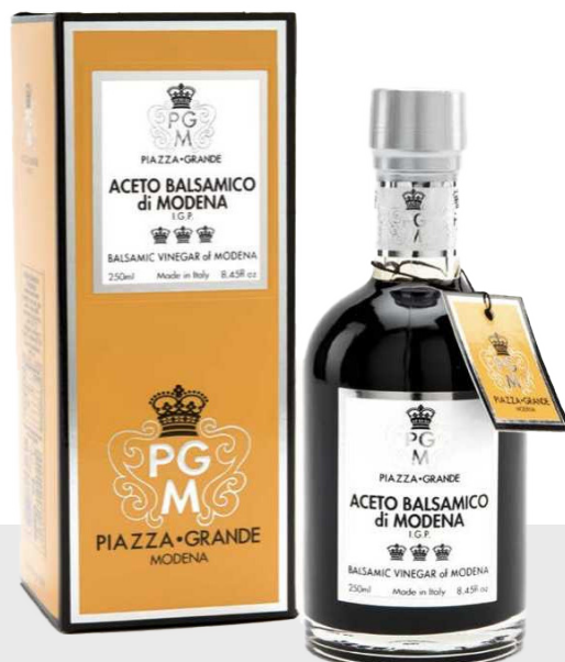
Vinaigre balsamique 3 couronnes