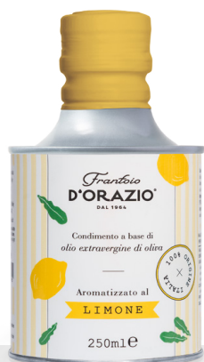
Huile d'olive Extra Vierge au citron