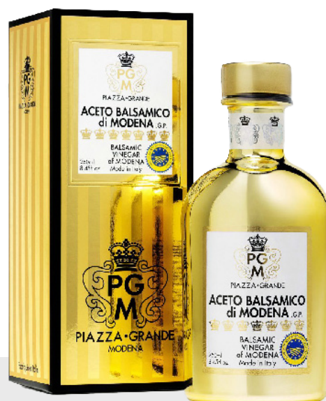
Vinaigre balsamique Oro Chrome