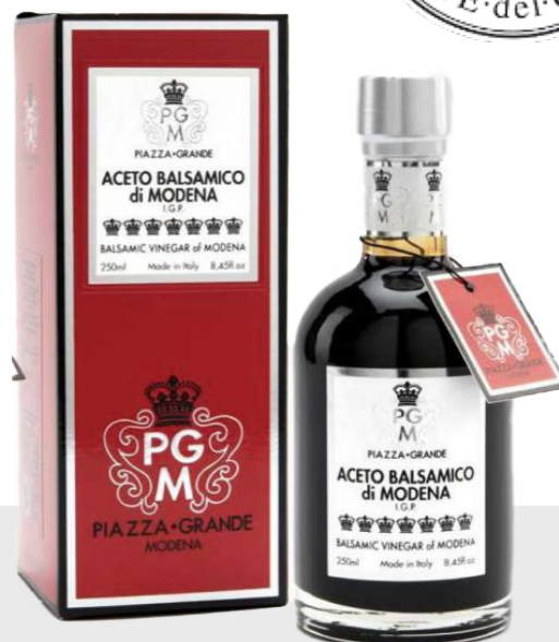
Vinaigre balsamique 7 couronnes