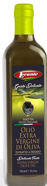
Huile d'olive extra vierge 100% italienne 12 x 75 cl 23009