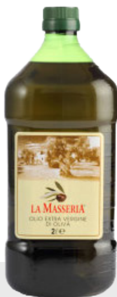
Huile d'olive extra vierge La Masseria 6 x 2 L 23128