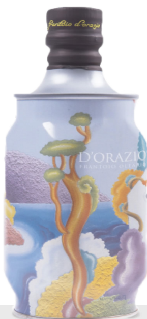
Huile d'olive Extra Vierge Paesaggio