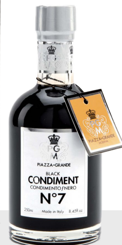
Vinaigre balsamique n°7 Piazza