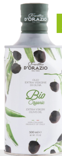
Huile d'olive Extra Vierge BIO