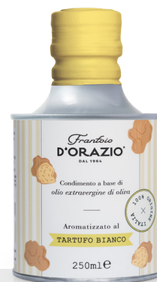
Huile d'olive Extra Vierge à la truffe blanche