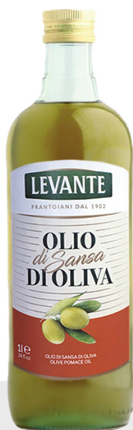
Huile de sansa 6 x 1L 26069