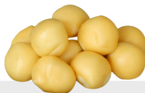
Mozzarella Ciliegine fumée