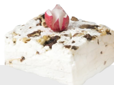
Giuncata aux noix