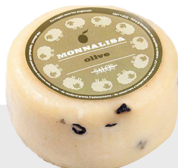
Monna Lisa aux olives