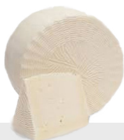
Primo sale brebis