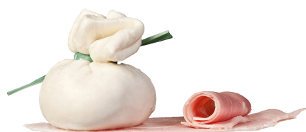
Bocconcini farci jambon