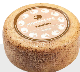
Monna Lisa Rustico Stagionato