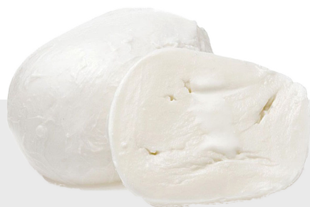
Fior di latte