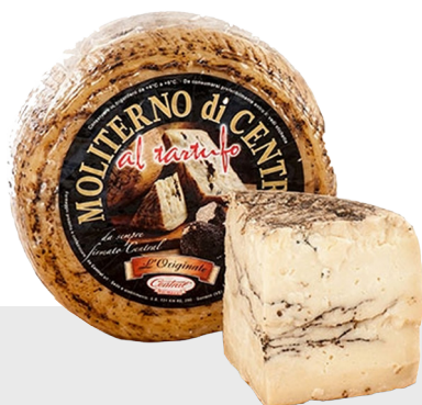
Pecorino Fiore Sardo DOP