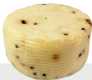
Pecorino au poivre