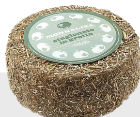
Monna Lisa Stag. in Grotta