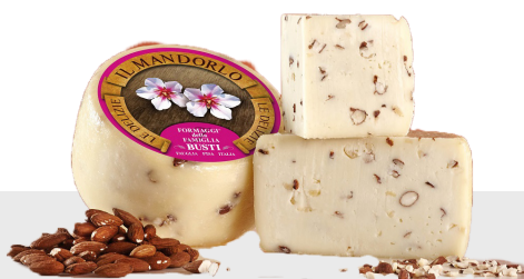
Pecorino Toscano aux