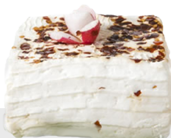
Giuncata au piment