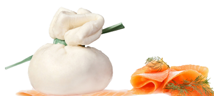
Bocconcini farci saumon