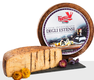
Cacio vieilli au vinaigre balsamique