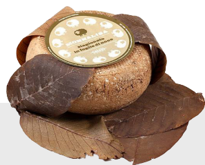
Monna Lisa aux noix