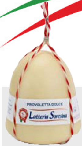
Provoletta Environ 1.5 kg 12264