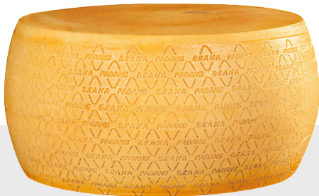
Grana Padano 16 mois Environ 4 kg 12010