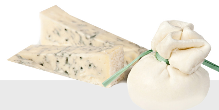
Bocconcini farci gorgonzola