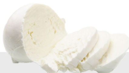
Mozzarella Anni 60