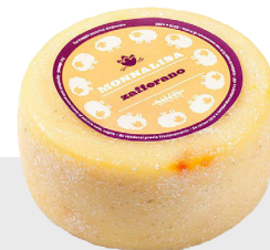
Monna Lisa au safran