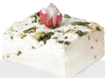
Giuncata à la pistache