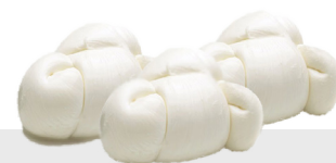
Nodini di Mozzarella