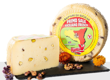
Primo Sale à la pistache