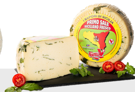
Primo Sale Siciliano