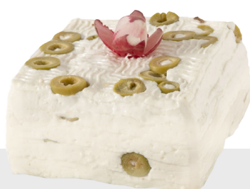
Giuncata aux olives