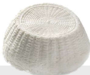
Ricotta de vache