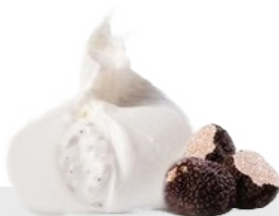
Burratine à la truffe