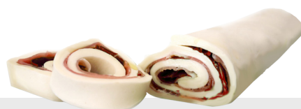
Rolle farci jambon cuit bresaola