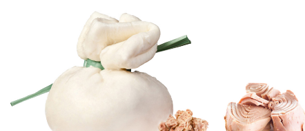
Bocconcini farci au thon