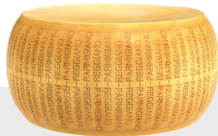
Parmigiano Reggiano 24/30 mois Environ 34 kg 12045