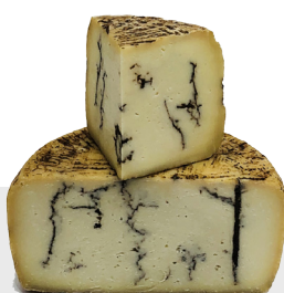
Pecorino Moliterno à la truffe