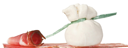
Bocconcini farci speck