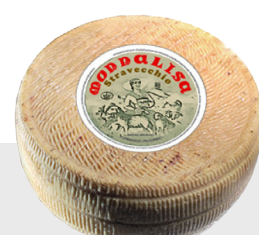
Monna Lisa Stravecchio