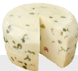
Primo Sale aux olives