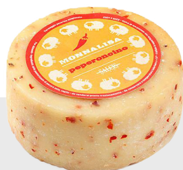
Monna Lisa au piment