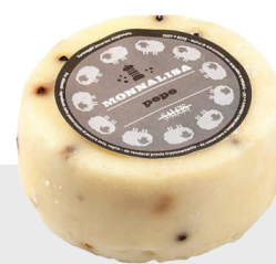
Monna Lisa aux 4 poivres