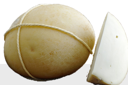
Caciocavallo di Bufala