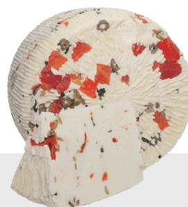
Primo Sale Fantasia