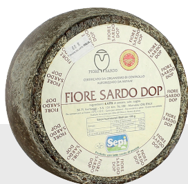
Pecorino Fiore Sardo DOP