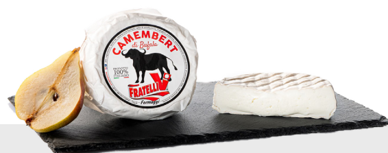
Camenbert di Bufala