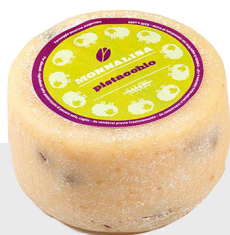
Monna Lisa à la pistache