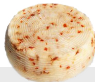
Pecorino au piment