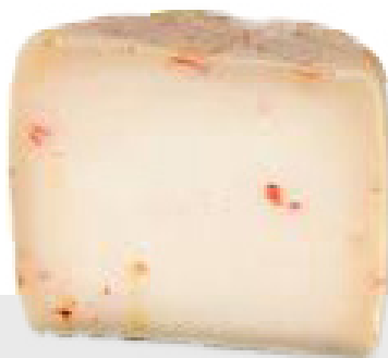
Fromage au piment