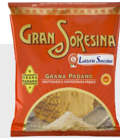
Grana râpée 16 x 100 gr 12009