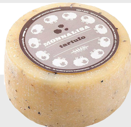
Monna Lisa à la truffe