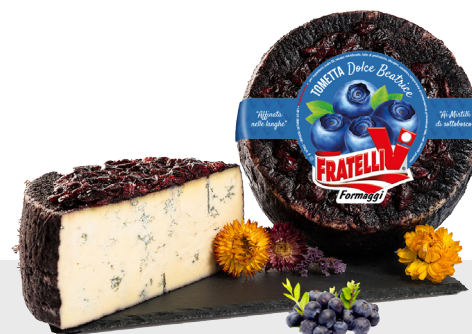
Tometta dolce aux myrtilles