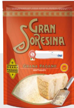
Grana râpée 10 x 500 gr 12103