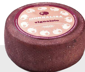
Monna Lisa Vignaiolo