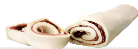
Rolle farci speck tomates