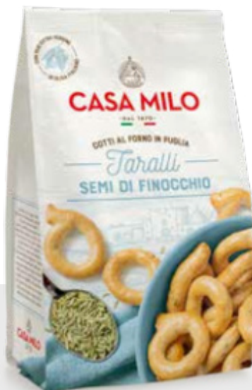
Taralli au fenouil