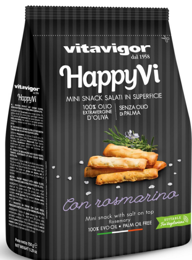
Mini Grissini au romarin