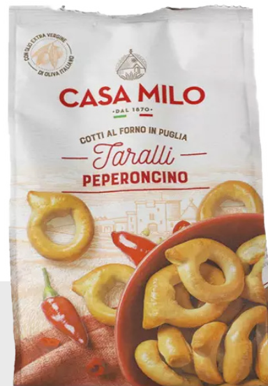
Taralli au piment