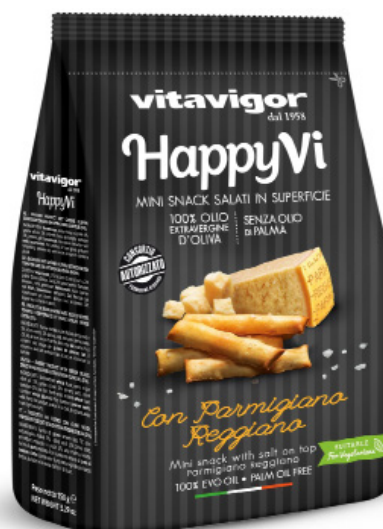
Mini Grissini au parmesan