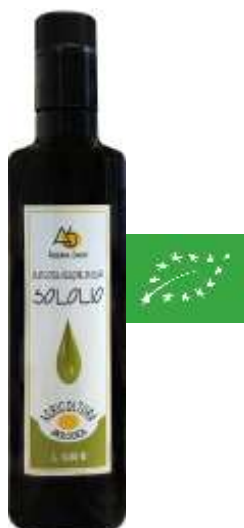
Huile d'olive extra vierge Sololio BIO