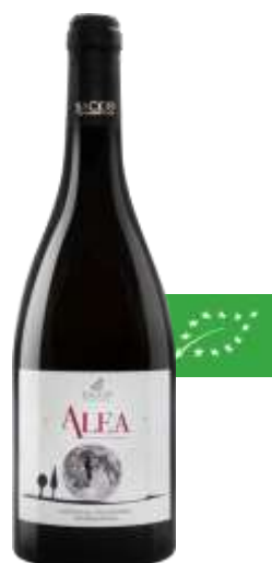
Falanghina Alea Puglia Bio IGP - Falanghina - 6 x 0.75l 1921