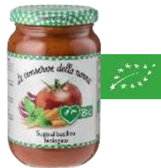
Sauce tomate au basilic BIO