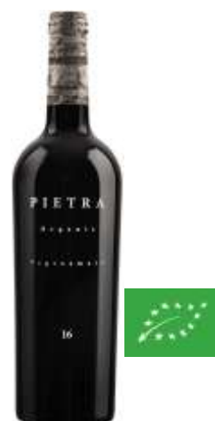
Pietra Negroamaro Bio IGT - Negroamaro - 6 x 0.75l 1902