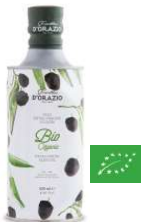
Huile d'olive extra vierge BIO

LA REFERENCE CI-DESSOUS EST SUR PRÉ-COMMANDE.