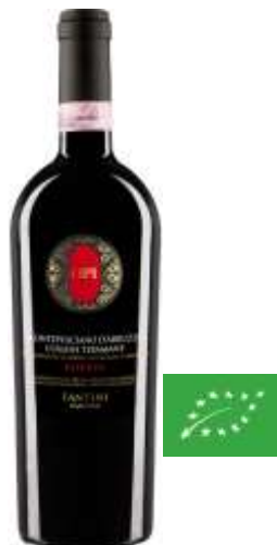
Opi Montepulciano Bio DOC - Montepulciano - 6 x 0.75l 1228