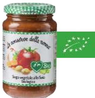
Sauce tomate au soja BIO