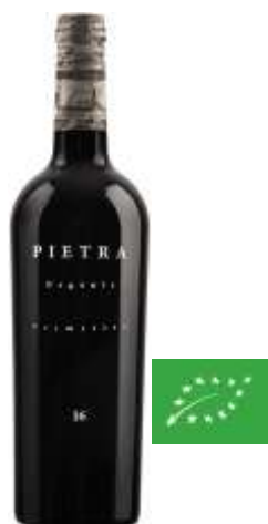
Pietra Primitivo Bio IGT - Primitivo - 6 x 0.75l 1901