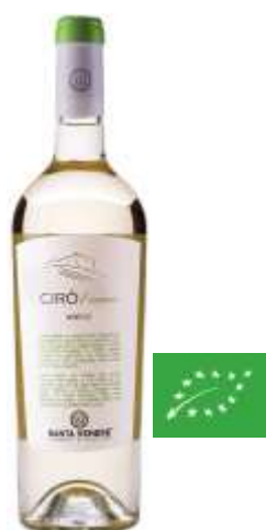
Ciro Blanc Bio IGT - Greco - 6 x 0.75l 1713